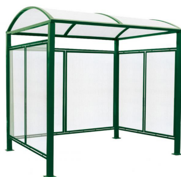
RAL 6005 - avec bardages