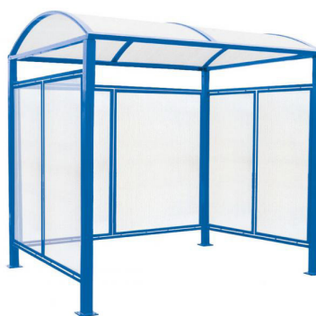
RAL 5010 - avec bardages