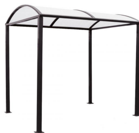
RAL 9005 - sans bardages