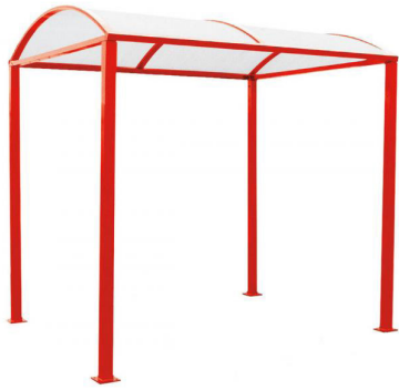
RAL 3020 - sans bardages