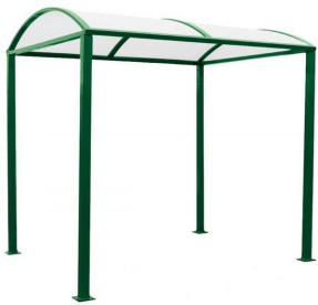
RAL 6005 - sans bardages