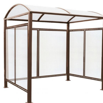
RAL 8017 - avec bardages