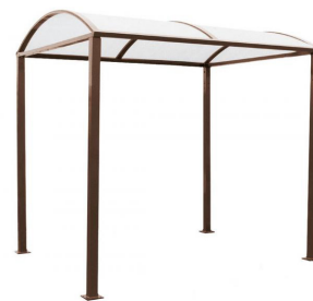
RAL 8017 - sans bardages