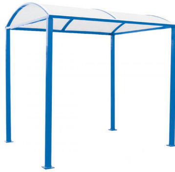
RAL 5010 - sans bardages