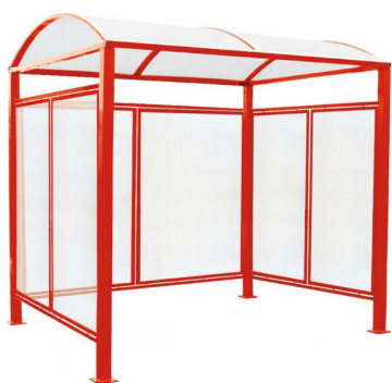
RAL 3020 - avec bardages