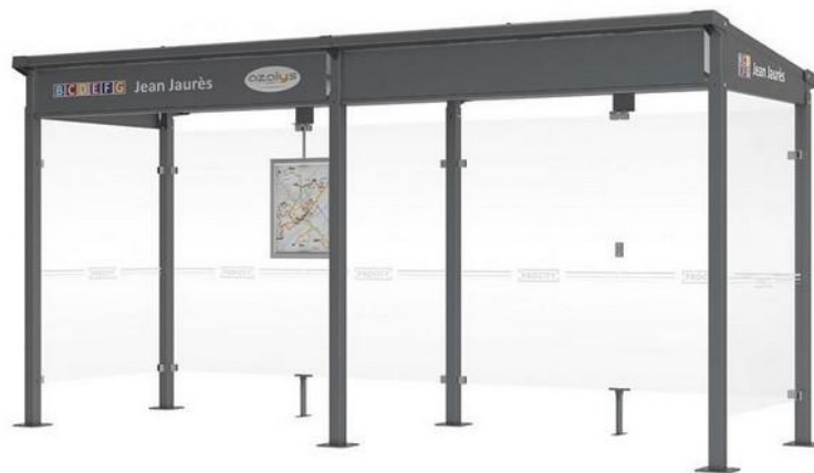
Abri bus MILAN - Longueur 5000 mm