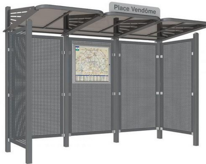
Abri bus CONVIVAL - Tout en acier